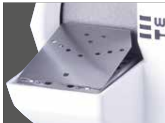
HSS-88 mit Schrägauflage, abnehmbar