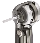
Dynamic Power Control